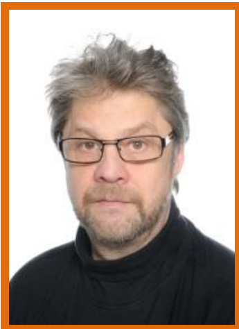
2 Juhani Aho